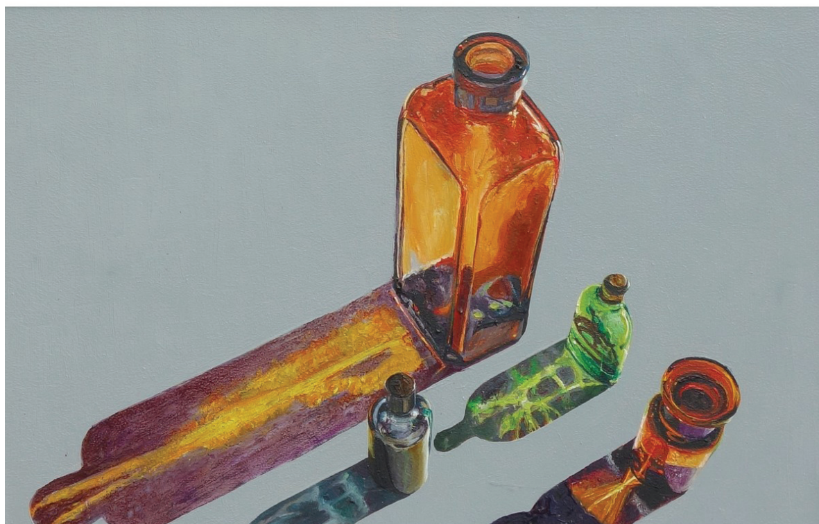
Szukálek Lajos: Üveg csendélet III.

És már semmi bajom, nagyil! Nem falt fel a kannibál kovid.