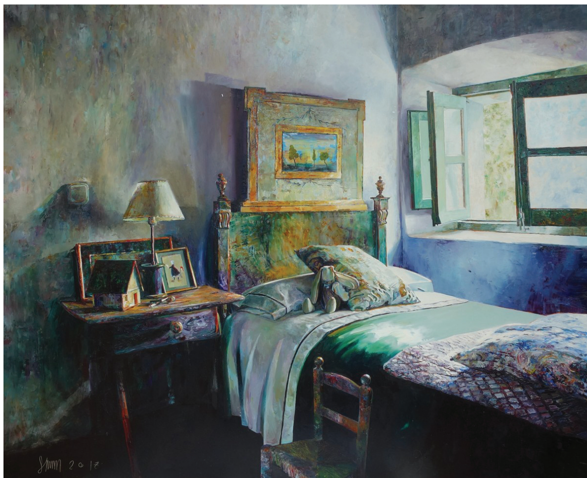
Szkukálek Lajos: Ágy, ablak

Erre válaszul éktelen visításba kezdett, hogy felhívja fiatal gazdija figyelmét. A kislány odaérve gyorsan letérdelt, és örömmel felkapta, majd magához szorította az elveszettnek hitt barátját.