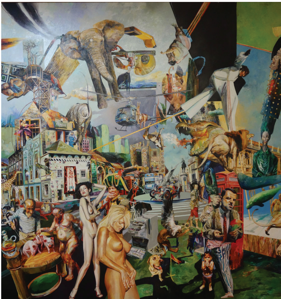
Szukálek Lajos: Megint jönnek

(Megjelent a Thy Catafalque zenekar Meta c. lemezén)