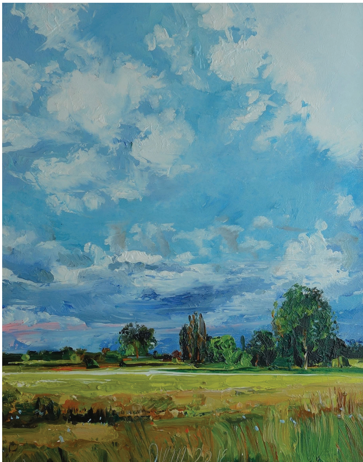
Szukálek Lajos: Tájkép I.