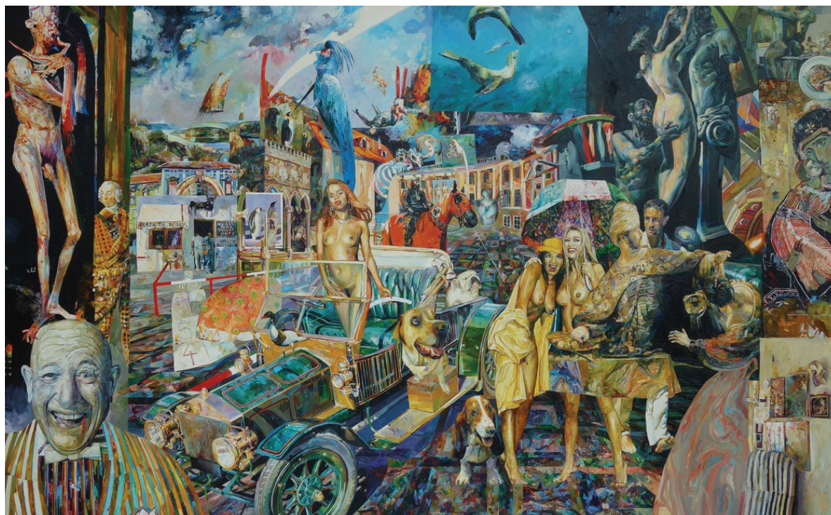
Szukálek Lajos: Tessék nevetni