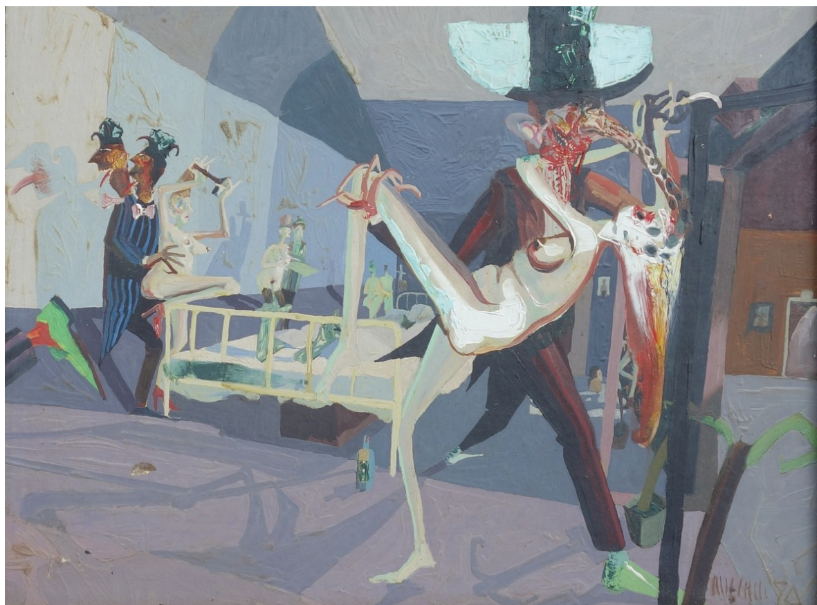
Szukálek Lajos: Vidám kórterem

A novelláskötetből kiérezhető szerzőjének viszolygása a modern világtól – itt bizony olyan „kartársakra” lelhetünk, mint C.S. Lewis vagy J.R.R. Tolkien –, az emberi arrogancia, a materializmus, a technológiai fejlődés kritikátlan imádatától. Ez szöges ellentétben áll a science fiction, különösen az „aranykor” tudományba vetett optimizmusával. A mai olvasó számára is élénken avantgárdnak tűnik, a szépirodalom főáramlatára rezonál, ezt sajnos kevésbé tolerálta kora zsánerének olvasótársadalma. David R. Bunch életében alulértékelt író maradt, kicsit nihilista, kicsit abszurd, egy igazi költő a lektúr szerzők sokadalmában. A huszonegyedik század olvasója viszont készen áll Bunch befogadására. Az irodalom disztópiákkal teli, a hírek dühöngő embereket mutatnak, a mai háborús bűnök világában a novellák nagybetűs felkiáltásai ebben a kontextusban nem tűnnek helytelennek, a diskurzusban teljes a keveredés: a tegnapi szatíra ma üzleti szalg cím. Ami egykor visszataszítóan olvashatatlan volt, most ott toporog a valóság előszobájában. Moderan utolért minket, vagy inkább mi értük utol?