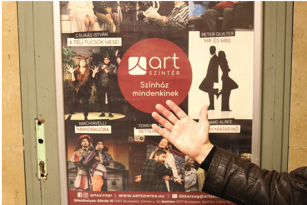
Szombathy Bálint munkája