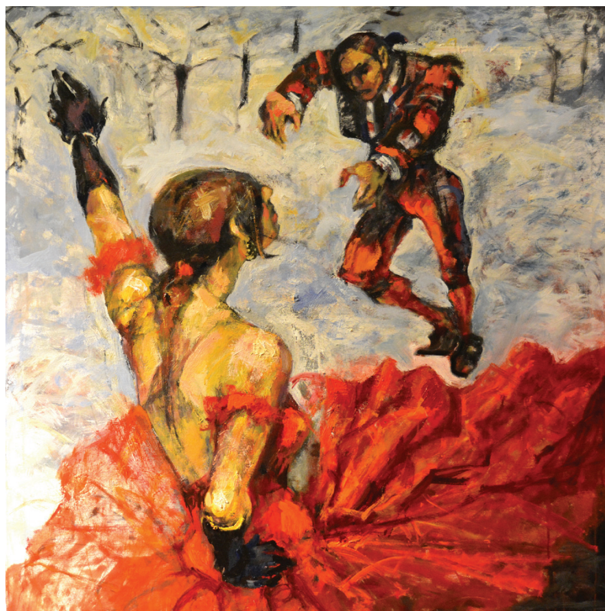
Örs Ilona: Paso doble