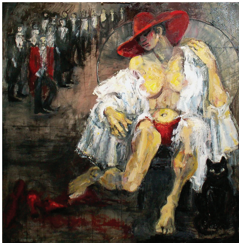
Ósz Ilona: Rejtély

Alakja halála óta a felvidéki magyar irodalmi tudatban ugyan kissé megkopott, de ez sajnos más írókkal és költőkkel is így van, szülőfalujában azonban minden évben megemlékeznek róla, ráadásul a pelsőci magyar alapiskola az ő nevét viseli és születésének centenáriuma alkalmából egy nagyobb rendezvényt is terveznek, valamint egy gyermekverseket tartalmazó kötet is meg fog jelenni a dunaszerdahelyi Lilium Aurum gondozásában.