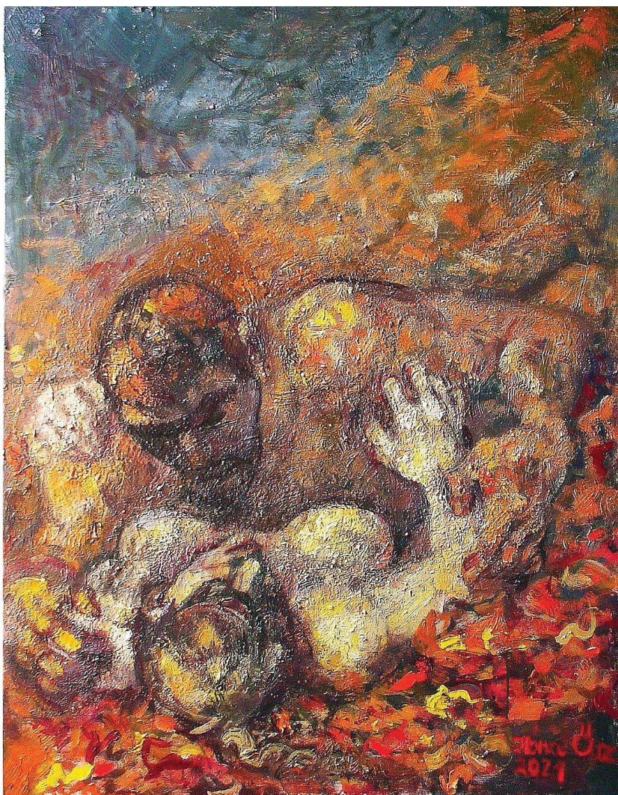
Ósz Ilona: Héjanász

(Tózsér Árpád: Akhilleusz beéri a teknőst. Naplók naplója (2013–2020), Kalligram, Pozsony, 2022)