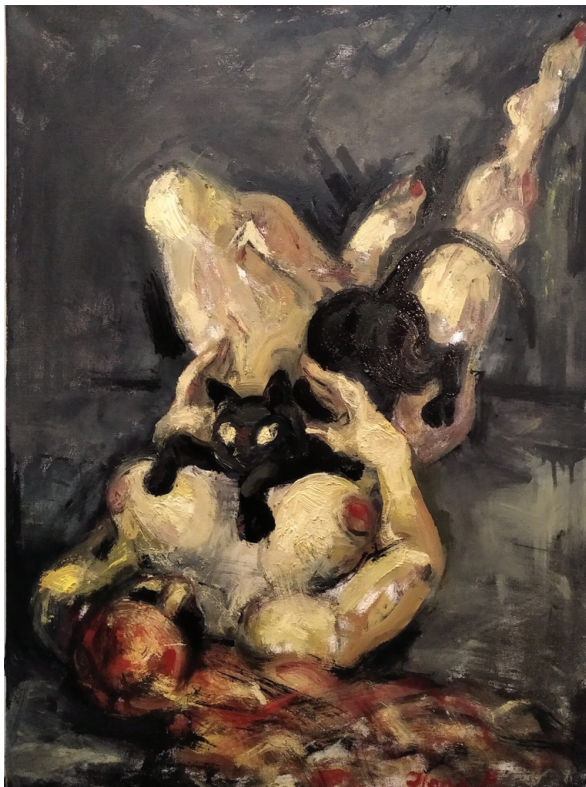
Ósz Ilona: Fekete macska

Egyezséget kötöttem vele, s most az életemmel fizetek.