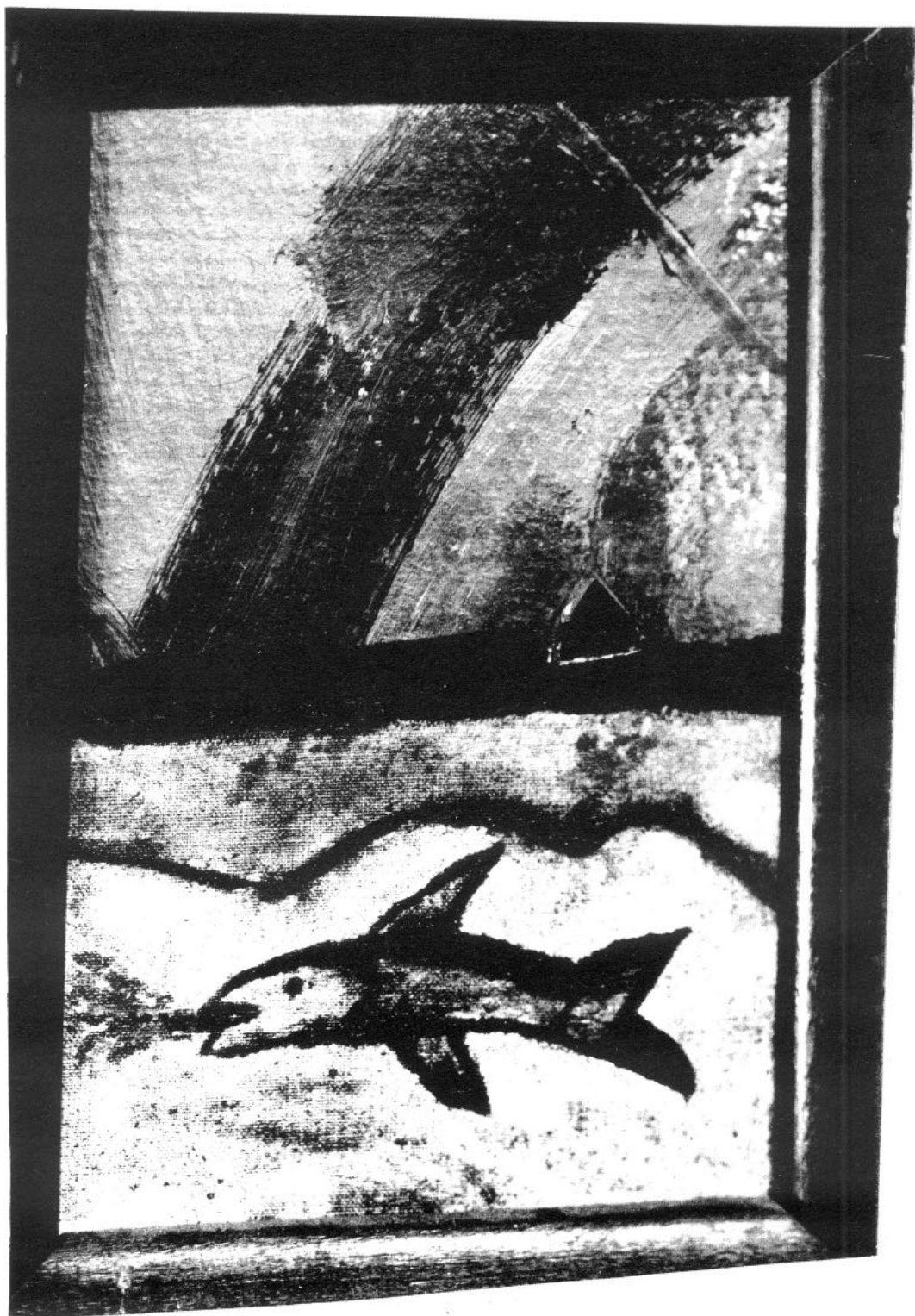
Cím nélkül, 1981