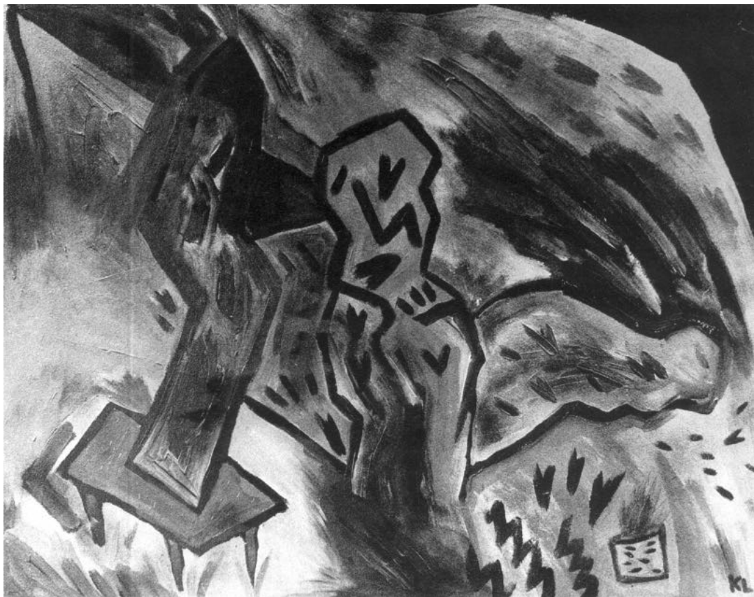
Tóparti séta, 1986

Leginkább mégis a ciklusok szerint rendezett olvasatban érhető utol, vagy határozható meg: a Tf. az emberen túl(i)ra, a természetre tekint, a Mon. egyetlen verse a gyermekkor mindennapiságába, A Cs. Kir. a szerelem mindenki által megélhető mozzanataiba vezet, a Hv. pedig a tisztára ömlő szennyet, a harmóniából fogadó káoszt verseli meg.