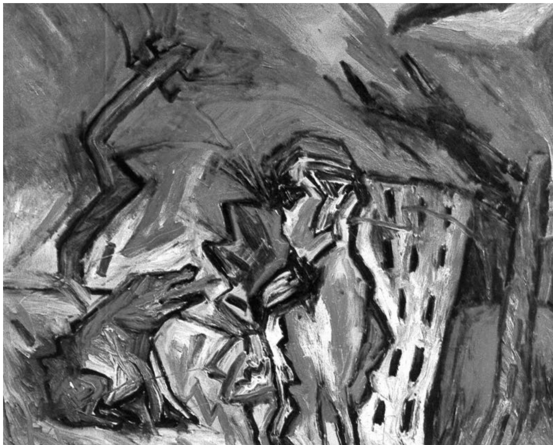
Felvillanyozott eufória, 1985

szóltam az udvarhölgy (japánul njóbónak nevezik) Szei Sónagon Makura no szósi c. prózai írásáról. Innentől ezt a művet és illendőségből ugyanígy a szerzőjét is igyekszem valamelyest alaposabban bemutatni.