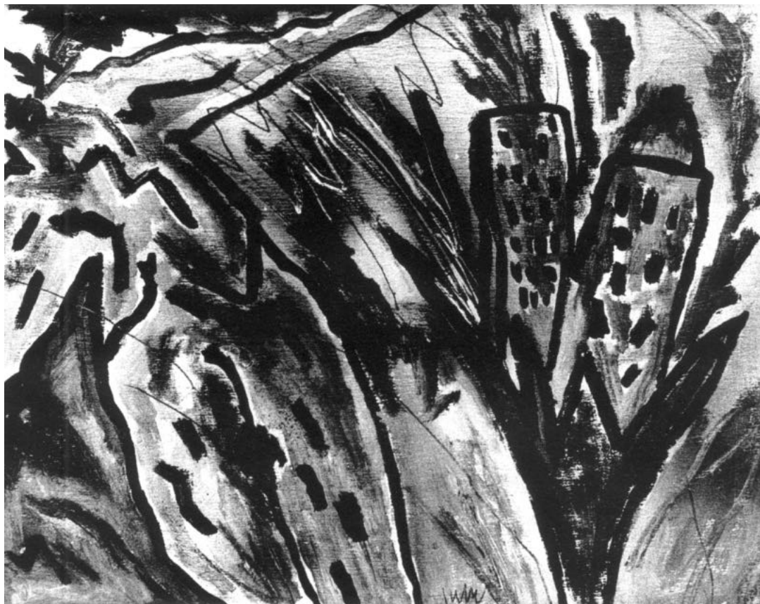
Cím nélkül, 1985

49 Uo., 82. Vö. még: „A műthosz-nak ezt a kitalálását kell szembeállítani az argumentációval, a retorika keletkezési pontjával. Míg a retorika becsvágya a hallgatósággal való kapcsolattartásban és a korábban elfogadott gondolatok iránti tisztelet következtében korlátokba ütközik, addig a poétikát az alkotó képzelet által teremtett újdonság jellemzi.” Uo. 50 Uo., 83. Külön érdekes, hogy poétika és hermeneutika viszonyában a szerző láthatóan kevésbé talál hasonló „elkülönítő” határokat. A hermeneutika „meghatározhatóságát” a történetiségben keresve az exegézis, a filológia és a jogi hermeneutika tapasztalatával