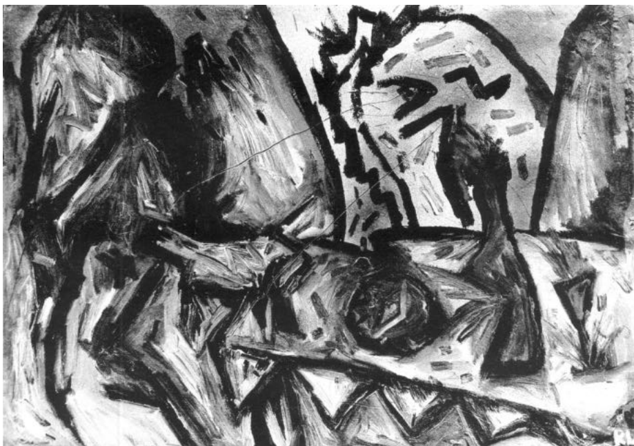
Időzített vacsora, 1985

Alapvető festői érdeklődése ellenére Kerekes folyamatosan keresi az átjárásokat más médiumok felé. Multimediális tevékenysége 1986-os berlini letelepedését követően válik igazán kifejezetté, miután performanszokkal megtűzdelt intenzív installációs munkálkodásba kezd. Munkáinak megrögzött témája a népek vándorlása, a kisebbségi lét és a balkáni háború, melyet távolról, a közmédián át követ. Az önkéntes száműzetésként is értelmezhető távollét és a tehetetlenség újabb apropó, hogy folytassa önmarcangoló, lelkiismereti kérdéseket felvető élet- és munkastílusát, s beteljesítse a lassú önmegsemmisítés hitvallását. Bár Berlinben is száz számra halmozza alkotásait, azok nem épülnek be sem a vajdasági, sem pedig a tágabb magyar művészeti tér értékrendszerébe. Nemcsak azért, mert nincs velük szerves kapcsolata, hanem mert az általunk ismert közeg kiveti magából azt a konfliktusos, sehová be nem illeszkedő művészt, amilyen Kerekes László volt.