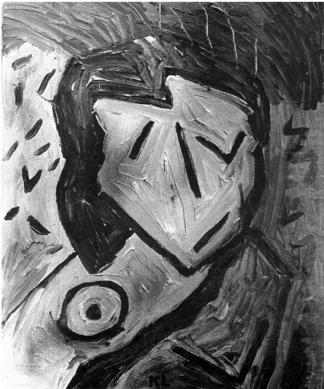
Női arckép, 1986