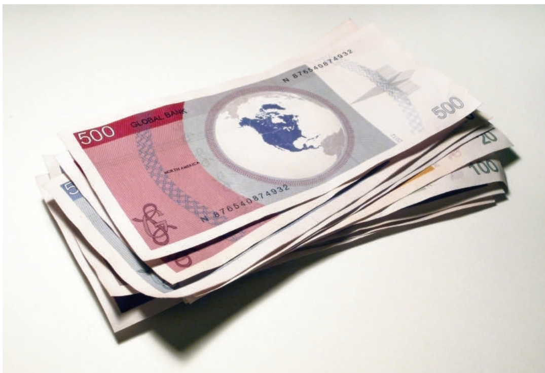
Global , objekt, 14.5 x 6.8 cm, 2010.