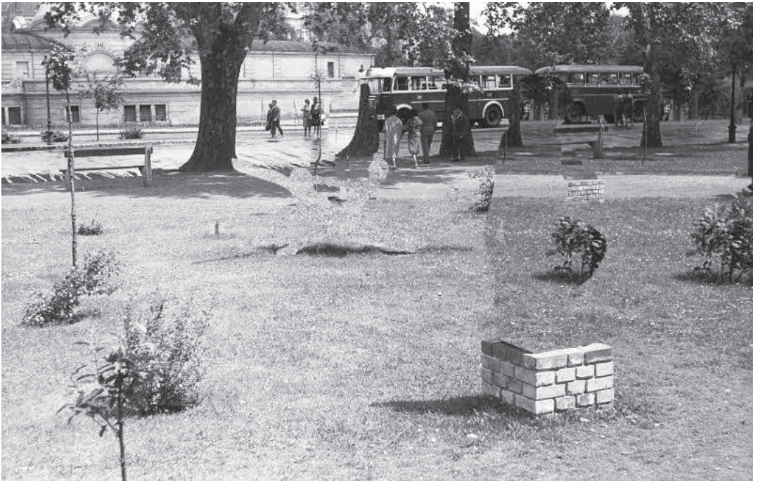
Ghost Veil (25.), manipulált diapozitív, 2015