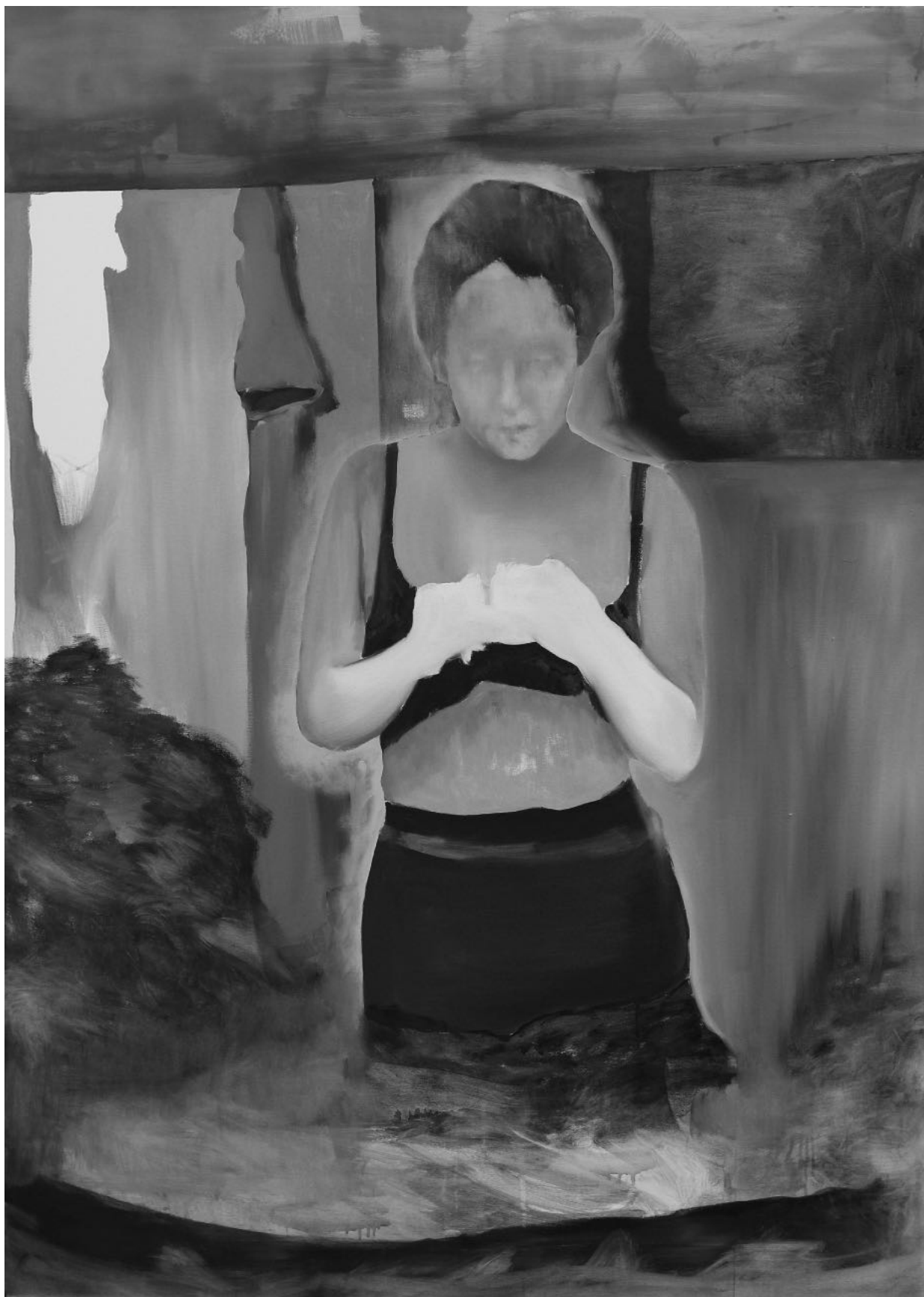
Nincs szelfi , 140x100 cm, olaj, vászon, 2019