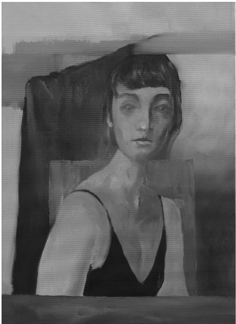
Szefi, 50x70 cm, olaj, vászon, 2019

Mivel a múlt század még egy területnek meghozta a sikert a bűn témájában, most egy kitérő következik, mert érdemes felviláglantani a filmek, a televíziós bűnügyek világát, legalább a valami oknál fogva egyedi darbjait. Mintegy a női egyenjogúság jegyében, vagy nem, de már 1957-ben leforgatták, Beverly Garland főszereplésével az első olyan amerikai bűnelkövetős sorozatot, részenként nagyjából harminc percben, amiben nő volt a zseniális rendőr, egyáltalán a főszereplő, hol máshol, New York városában. A „ Decoy: Police Woman ” sorozat forgatása a