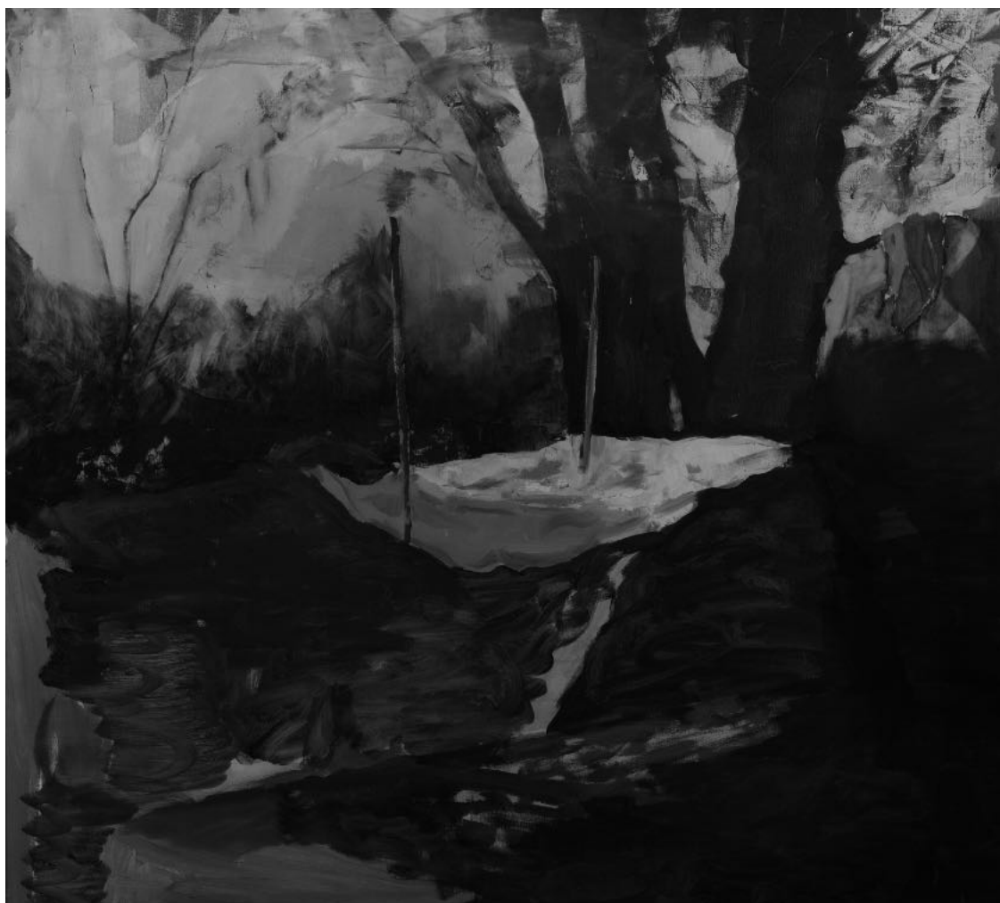
Cím nélkül (Mulandó) , 100x110 cm, olaj, vászon, 2017

Panaszlevelünket a [REDACTED] és a [REDACTED] számú kormányrendeletekre hivatkozva semmisnek tekinti Dr. [REDACTED] [REDACTED] bíró