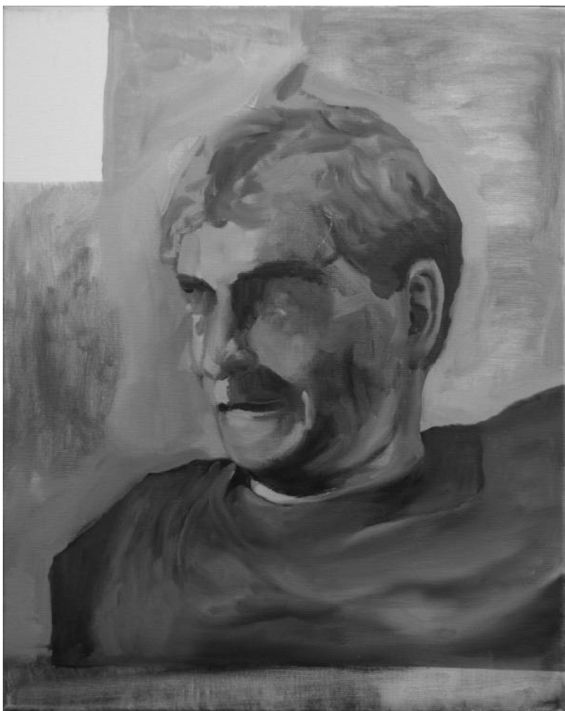
Időtlenység , 40x50 cm, olaj, vászon, 2018

A Ködváros című opus már sokkal kimunkáltabb, kliséket és rettegést mellőző, érzékekre ható, misztikumra építő szöveg. Leginkább a novella matrjoska-szerű felépítése adja annak különlegességét. Az első egy link, mely egy blogra „irányítja” az olvasót. A szöveg maga tehát egy blogbejegyzés, mely egy ki nem adott könyv, Magyarország ki nem adott könyveinek történetét meséli el. A könyvön belül szereplő egyik ilyen Péterfy Balázs A titkos város – helyi rocktörténet című lett volna. Péterfy több mint kilencvenhét interjút készített el, azonban könyvét nem fejezte be, ugyanis rejtélyes módon eltűnt. Az interjúkból megtudjuk, hogy egy idő után már csak a Ködváros nevű zenekar után kutatott, s az ezt követő diskurzusokból megtudta, hogy „tulajdonképpen mindenki ismer valakit, aki már járt Ködváros-koncerten, vagy aki el akart menni egy koncertre”. 36 Az a hír járta, hogy soha senki nem tudja, hol fognak játszani, s ha játszanak is, őket magukat nem, csak a homályból átszűrődő lebegő árnyékokat lehet látni. Balázs legutoljára kedvenc rock-kocsmájában, ahol a tervezett koncert elmaradt, azonban éjfél után mégis