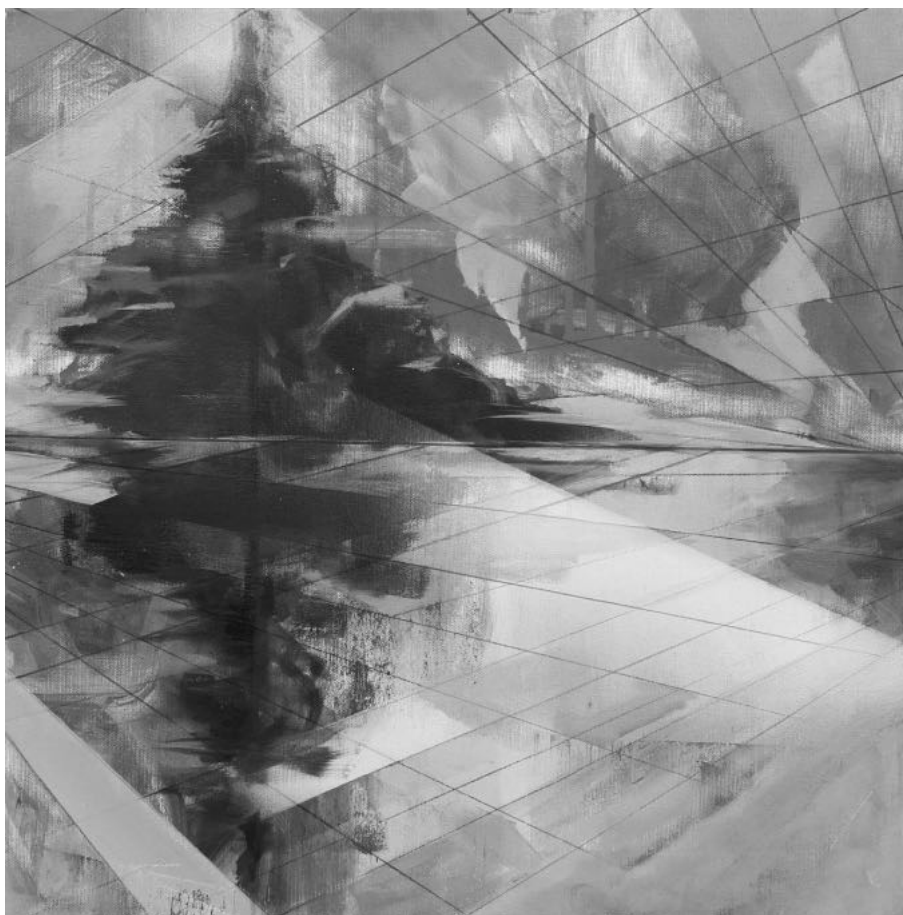
Metafizikus tér, 50x50 cm, vászon, vegyes technika, 2016

Biztosan van, aki a könyv végigolvasása után azt mondja, képtelenség az egész. Valóban. De úgy vélem, szépirodalmi könyvet nem feltétlenül azért kell olvasni, mert az minden szavában a valóságról fog szólni. Nem. Inkább a közlendő, a rámutatás valamire a lényeg.