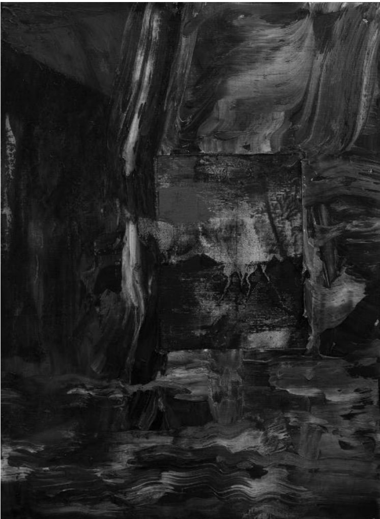
Cím nélkül (Integráció), 30x40 cm, olaj, vászon, 2017

nalon. Nincs abban semmi kivétel, hogy nem vártad meg, amíg tanítód derékszögbe hajlik, s mogyoróvesszőjével összecsapott ujjaidra számolja a mákost. Nem tehetsz róla, hogy a mai napig itt vágyakozol saját használatú leukémiás hegyeid előtt a többi halovány áldozattal. Jársz körbe velük ugyanazon a helyen, és már hányadszor juttatták eszedbe, hogy eközben máshol vagy mégis. Egyetlen mozdulat a tiéd, egyetlen lendület, már másé a következő, s az arra rákövetkező hajlásával áll össze a folytatás. A magasságnak semmibe se kerül elindítani a laterna magicát, táncolsz engedelmesen a többiekkel a fényesre taposott úton. Addig, amíg fel nem merül benned a kérdés: hogyhogy csak a táncosokat ünnepli a közönség, amikor te is velük járod?