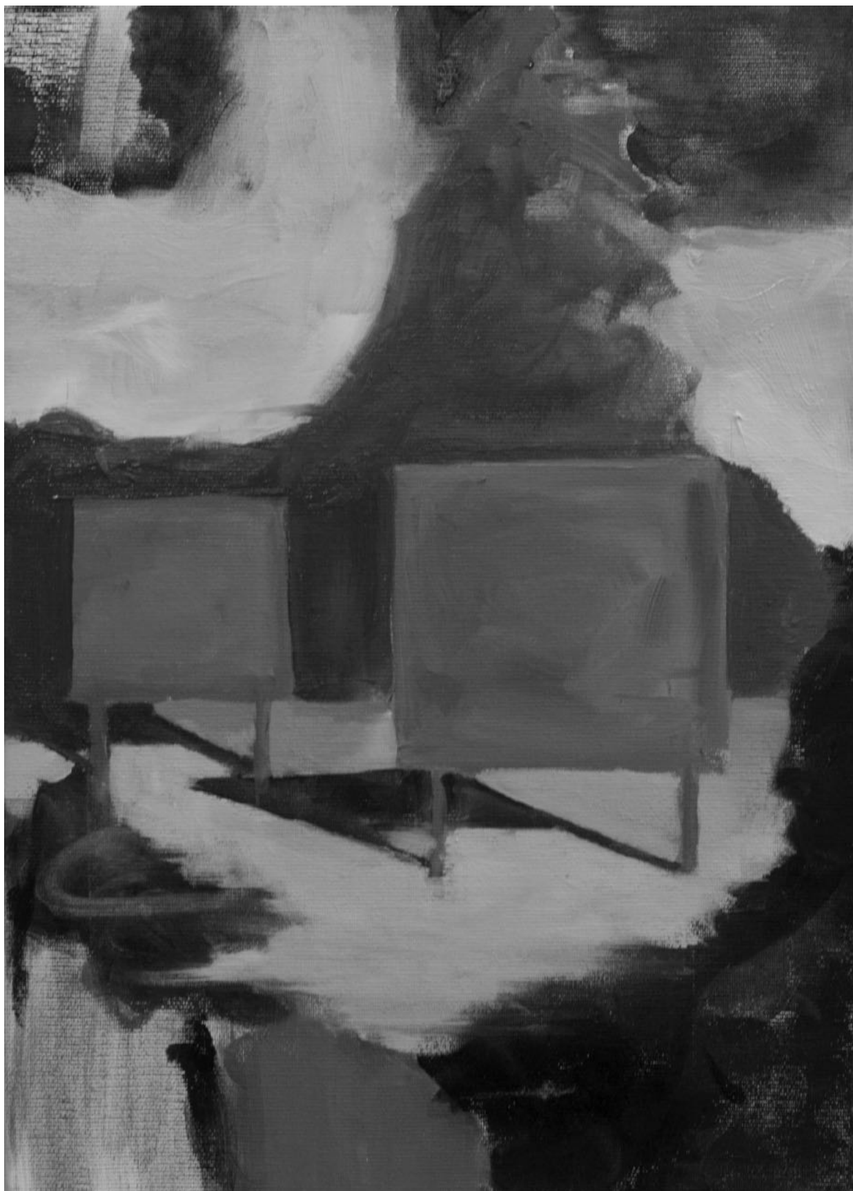
Cím nélkül (Nélkülözők) , 25x35 cm, olaj, vászon, 2017