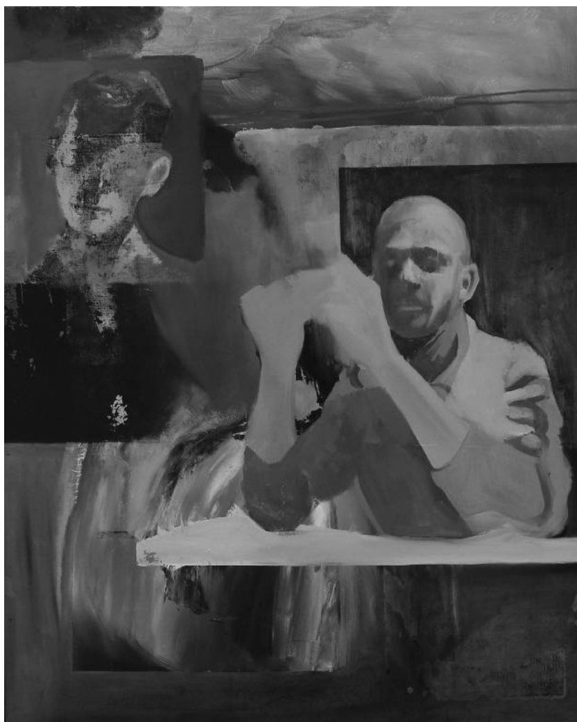
Negatív szelfi , 80x100 cm, olaj, vászon, 2019

lő 1931-től kutakodik, 75 regényben és 28 novellában. Alakját az akkori párizsi bűnügyi rendőrség, a Brigade Criminelle rendőrtanácsosáról, Georges-Victor Massu-ról koppintotta. Ő kerített kézre egy huszonhétzseres emberöléssel vádolt személyt, Marcel André Henri Félix Petiot tényleg vérben tocsoghatott, lakása alagsorában – amit fel kellett törni, mivel a házból penetráns füst gomolygott kifele – többek közt az egyik kandallóból női kéz „integetett”, a padlóról meg egy levágott vértócsás fej „köszönt vissza”. Simenon körül más furcsa-