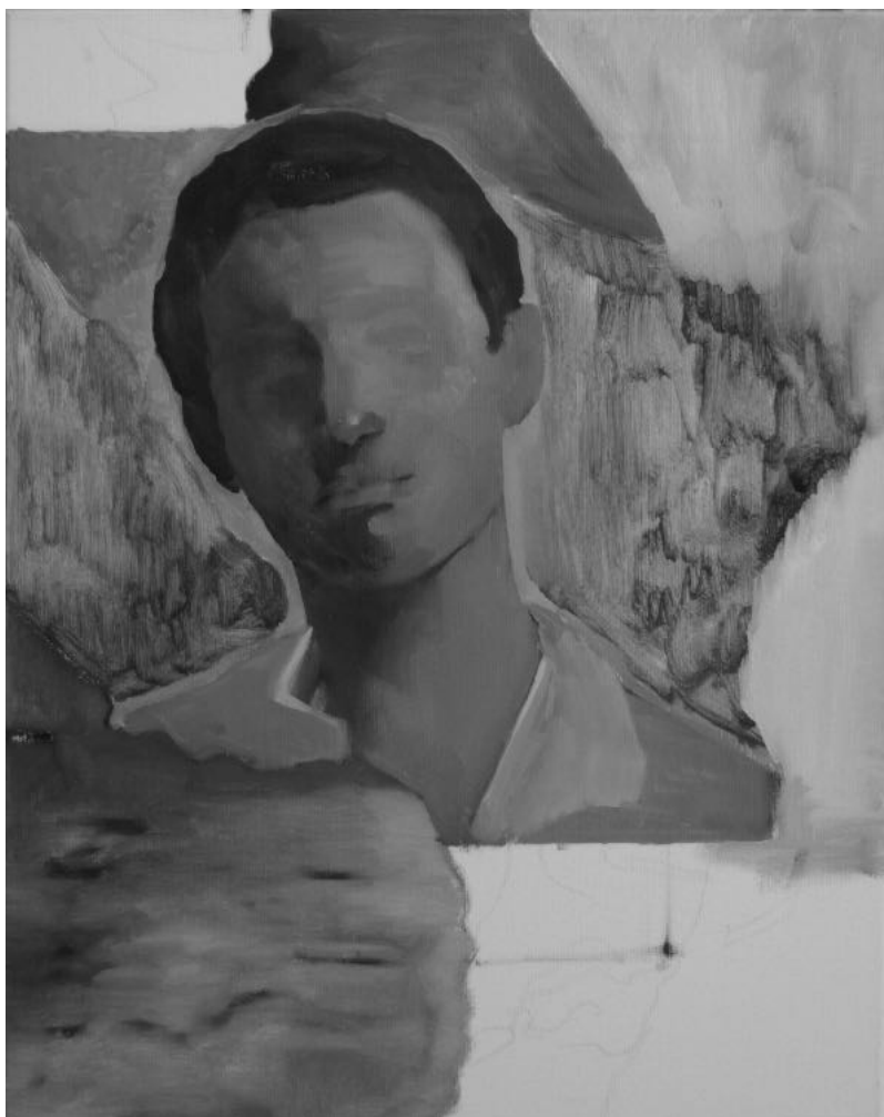
Mosoly , 40x50 cm, olaj, vászon, 2018

Veres Attila novelláskötete azokaz az olvasókat célozza meg, akik szeretik az abszurd és groteszk megoldásokat a szövegeken belül, a fantáziadús, ámbár borzongással teli helyszíneket, akik a hétköznapiok egyhangúságából a megmagyarázhatatlan, megválaszolatlan kérdésekkel teli világokba menekülnének.